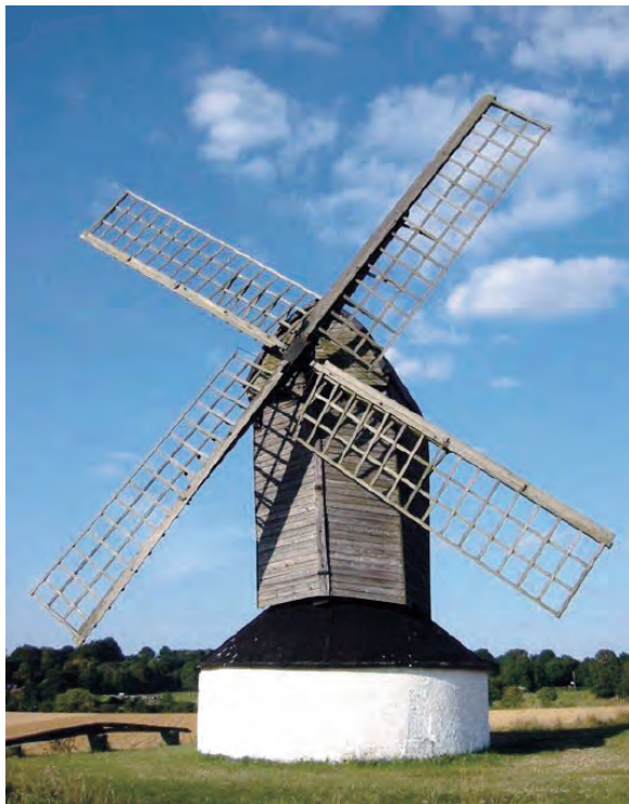
Slika 1.1: Drevna vjetroturbina za mljevenje žita

Drvo i energija vjetra su prvi oblici primarne energije koju je čovjek koristio. Vjeruje se da je energija vjetra korišćena za navodnjavanje još prije 3000 godina. Prvi pisani tragovi datiraju iz 200. godine p.n.e. i odnose se na vjetrenjače korišćene za mljevenje žita u tadašnjoj Persiji. Ove drevne mašine imale su vertikalne osovine sa krilima od drveta i trske. Početkom 12. vijeka vjetrenjače se pojavljuju u Evropi u modifikovanom obliku sa horizontalnom osovinom, slika 1.1. Nešto kasnije ove vjetrenjače su usavršene, tako da je rotor mogao ručno da se okreće prema vjetru ili van tog pravca u slučaju jakih vjetrova, kada je i platno sa krila moglo da se skine.